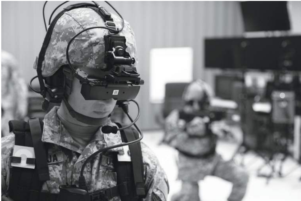
Figura 2: Instrucción basada en simulación

Cada soldado también recibe documentación que explica cómo usar el simulador.