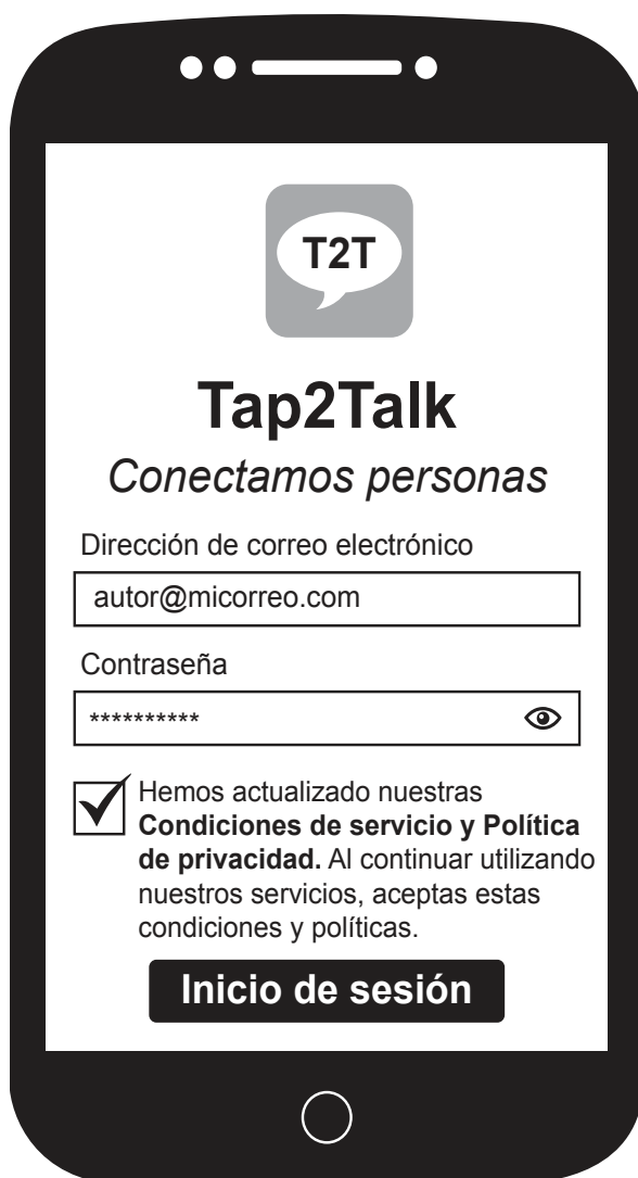
Figura 3: La aplicación Tap2Talk

Los usuarios pueden elegir si almacenar sus datos, como registros de sus chats, archivos de audio, archivos de video y documentos, en su dispositivo móvil o en un servidor de Tap2Talk en la nube.