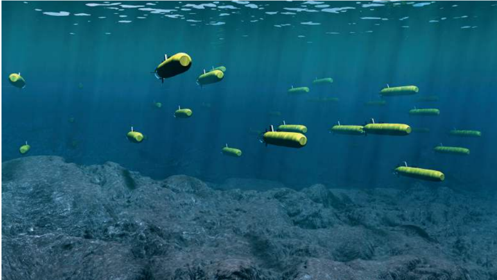
Figura 5: Ejemplo de una flota de robots submarinos autónomos

Octoworld es una empresa que planea utilizar robots submarinos autónomos para supervisar el estado de los arrecifes de coral en todo el mundo. Los robots estarán equipados con sensores para que puedan medir su propio movimiento en relación con los arrecifes de coral y el agua circundante.