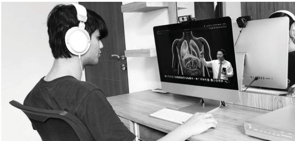
Figura 1: Entorno virtual de aprendizaje

Los profesores graban sus clases y las transfieren a la nube para que los alumnos accedan a ellas de manera remota.